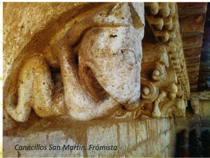
Canecillos San Martín. Frómista