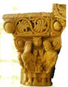
Capitel de San Zoilo

La iglesia de San Martín, única parte superviviente de lo que fuera el monasterio, aún conserva valores estéticos que hacen de ella una estructura excepcional en el corpus arquitectónico del Románico. Si bien fue objeto de una importante restauración cuyo exacto calado se ha ido conociendo más y mejor en lo que llevamos de siglo, esta no alteró de modo sustancial las líneas estructurales del edificio. Y ello ha permitido definir con claridad los fundamentos sobre los que se erigió, completamente dependientes de la sensibilidad litúrgica practicada por los monjes cluniacenses.