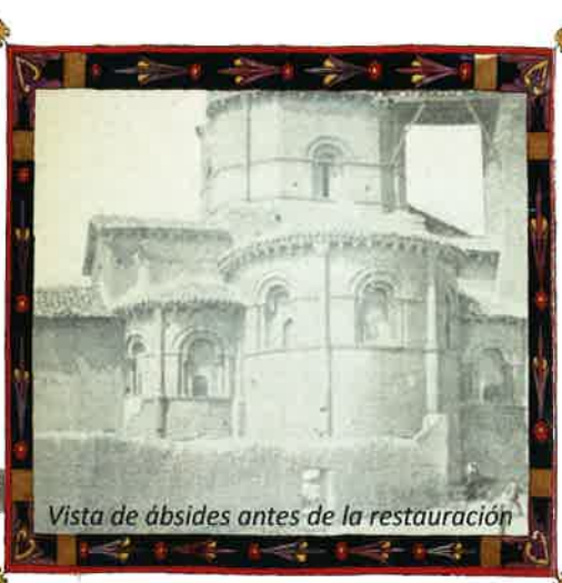
Vista de ábsides antes de la restauración