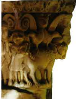
Capitel vegetal. San Martín de Frómista