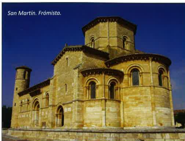
San Martín. Frómista.

Textos: José Luis Senra - D.L.: P-243/2018